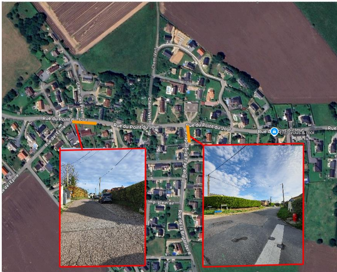
Plan d'installation du chantier