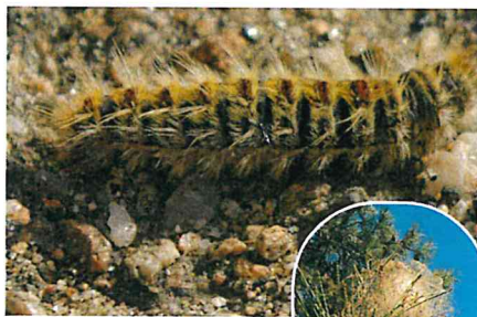
Nid sur branche Pin et cèdre