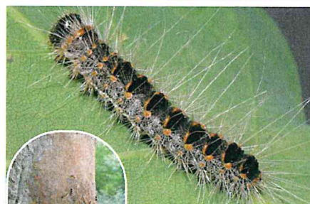
Nid sur tronc Chêne

Lorsqu'elles se sentent en danger, les chenilles libèrent des soies urticantes très volatiles. Elles se retrouvent dans les nids qu'elles confectionnent et qui les abritent.